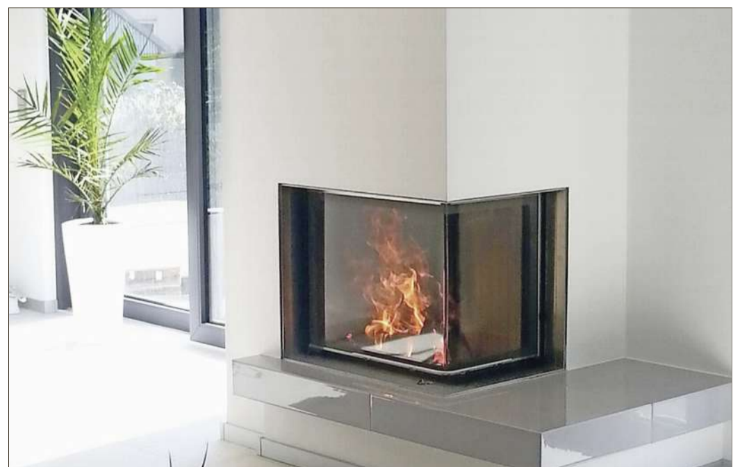
Wohlige Wärme durch ein modernes Ensemble im Wohnraum.