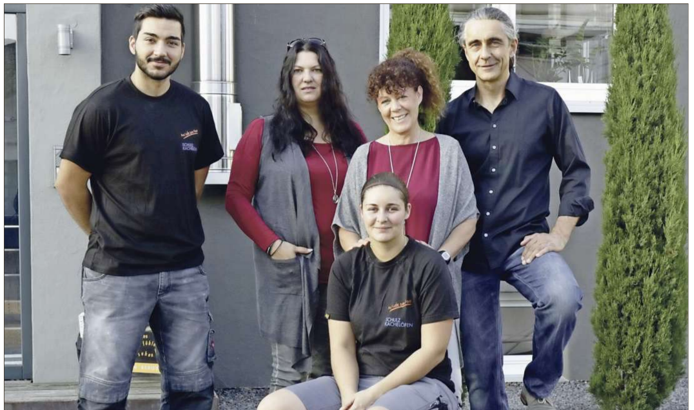
Das Team von Schulz Kachelöfen in Rastatt-Raental feiert am Wochenende den 30. Geburtstag des Unternehmens.

Zum Bergblick 1 • 76437 Rastatt-Raental Telefon 0 72 22 / 8 17 56 info@schulz-kacheloefen.de www.schulz-kacheloefen.de